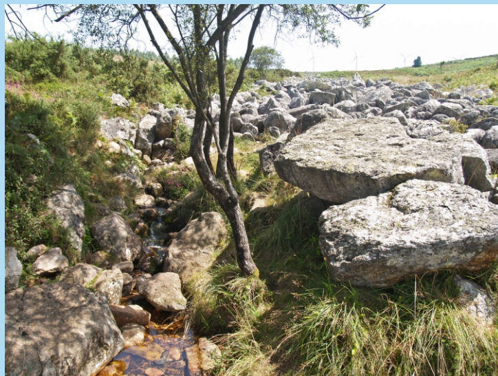
Pedregal de Irimia

Para comezar podemos achegarnos ao Pedregal, aínda que tamén podemos ir un pouco máis arriba e, pola pista do parque eólico, subir ao cume da serra desde onde se abranguen amplas panorámicas da primeira parte da cunca e da Terra Cha. Logo, ao longo do traxecto, atoparemos o primeiro Miño, Meira e Fonmiñá, áreas inundadas na Cha, caneiros, pontes, muíños, illas, a área de Santa Sabela en Outeiro de Rei, e preto a casa museo de Manuel María, despois Ombreiro, o pozo Piago e as illas de Meilán, Lugo co paseo fluvial, termas e pontes, até A Fervenza. CONCELLOS: Meira, Castro de Rei, Rábade, Outeiro de Rei, Lugo.